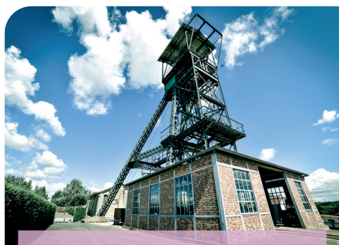
Blanzay Musée de la Mine