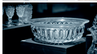
Le Creusot Château de la Verrerie