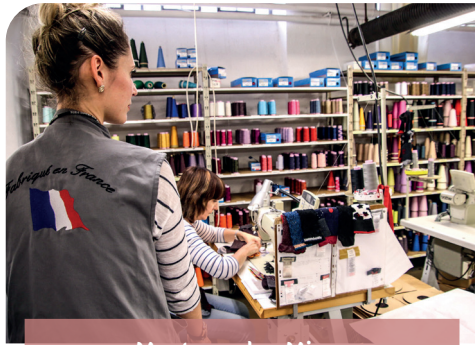
Montceau-les-Mines Manufacture Perrin