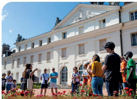
Le Creusot Visite «Côté cour, côté jardin»