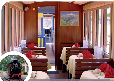
Le Creusot Voiture restaurant du Parc des Combes