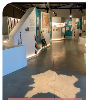
Gênelard Centre d'interprétation de la ligne de démarcation