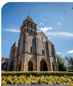
Perrecy-les-Forges Église Saint-Pierre et Saint-Benoît