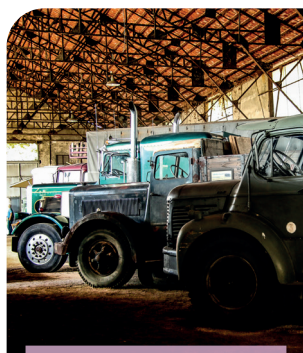
Montceau-les-Mines Usine Aillot Galerie du camion ancien